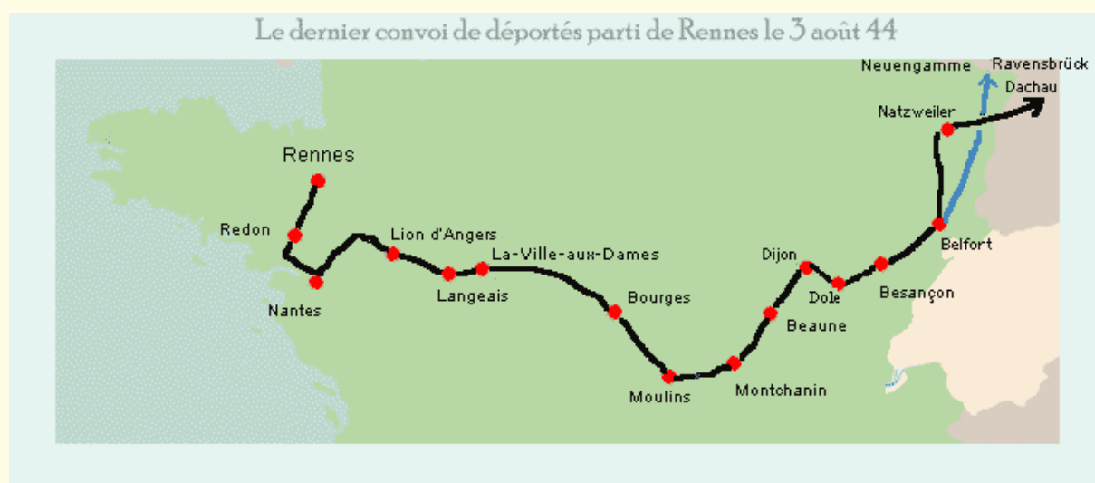
Parcours du dernier convoi de déportés parti de Rennes le 3 août 1944.